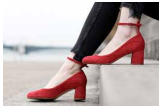
The mood journal